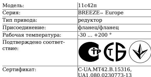
Таблица 1. Характеристики